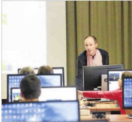
Un del tallers que va acollir ahir la UdL.

A partir d'un mapa, calcula la trajectòria per arribar a una destinació i es desplaça pel seu compte || La Nit dels Investigadors acull xarrades i tallers de divulgació científica i reuneix vora dos mil persones