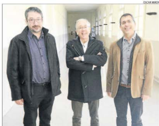
Tres dels investigadors de l'institut Indest.