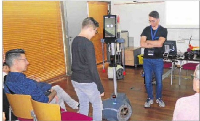
El nou robot, que porta per nom APR-02, és capaç de recórrer de forma autònoma l'interior d'un edifici.